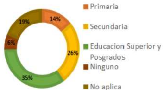
Nivel de Instrucción